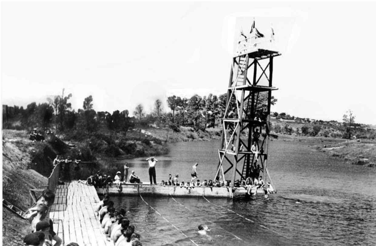
Вышка для прыжков в воду на Тускари

Тускарь и Боевка памятни еще и тем, как старшие ребята «научили» меня плавать. Меня пригласили покататься в лодке, я с удовольствием туда прыгнул, а на середине речки меня столкнули в воду. Я забарахтался, бил бестолково руками и ногами, но лодка медленно отплывала. Из последних сил я все же «доплыл» до лодки, и меня туда втащили. Вот такое было мое «боевое крещение». Ну, кое-как научился, неширокую Тускарь потом переплывал.