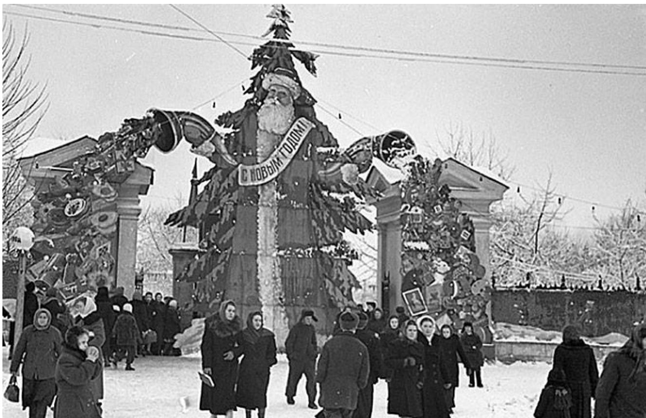
Вход в парк им. 1 Мая

В декабре каждого года сад преобразался, на его аллеях вырастал праздничный предновогодний городок. В многочисленных «палатках» продавались новогодние товары: игрушки, хлопушки, мишура, бусы и прочее. Все палатки и аллеи были ярко освещены, звучала бодрая музыка, и вокруг царило ощущение праздника и будущих сбывшихся надежд.