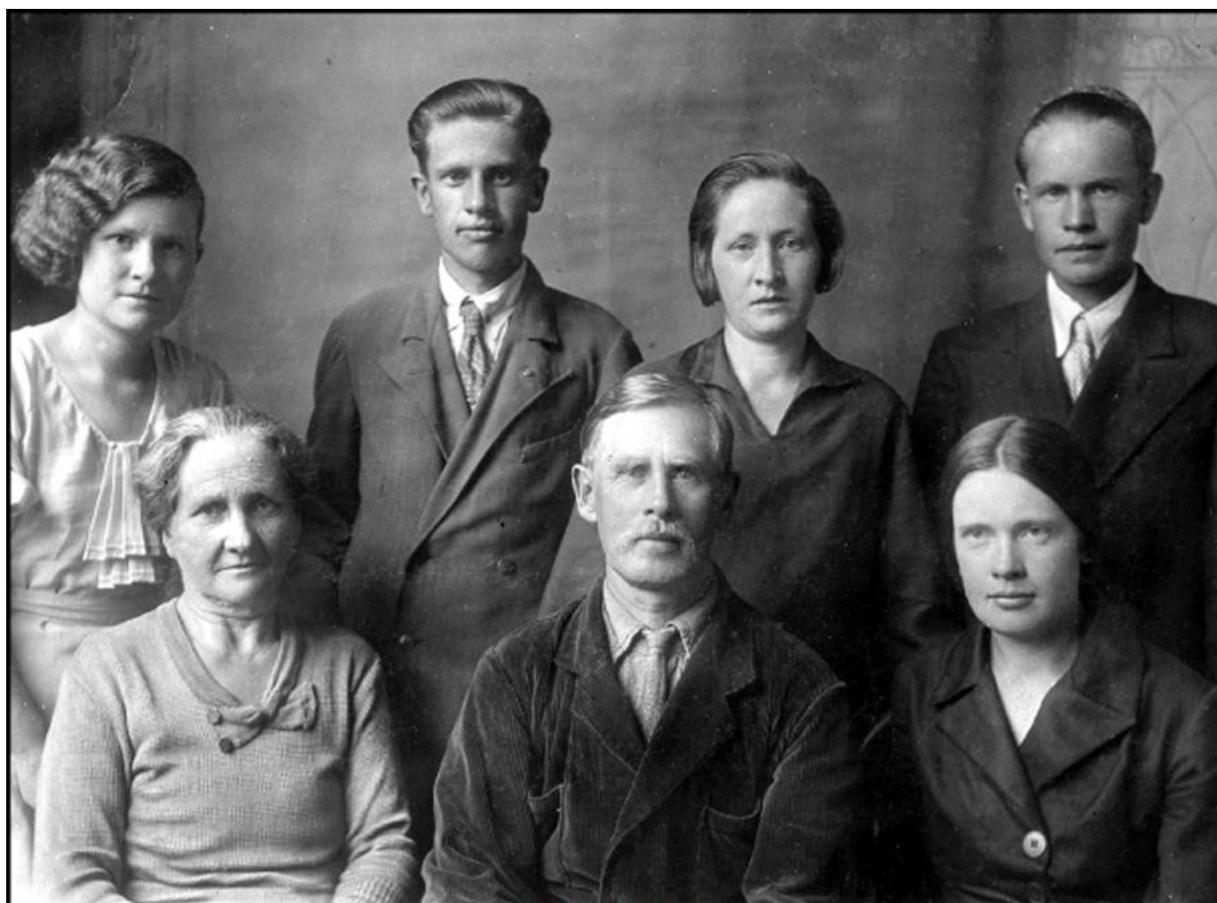
Дедушка, бабушка и 5 детей