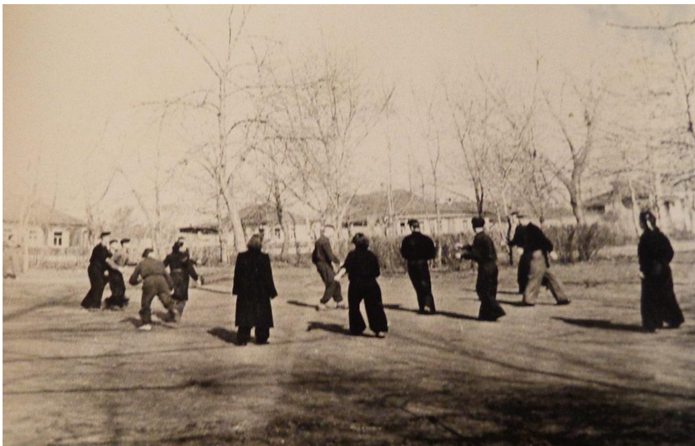
Физкультура в парке "Бородино"

Футбол был любимым развлечением на долгие годы. Потому что был прост и не требовал никакого снаряжения, кроме самого мяча да еще – вот ужас для мамы! – крепких ботинок. Это (ботинки) был кошмар, скандал, слезы. Но футбол не прекращался. Стадион «Динамо» тоже был для нас почти родным домом, но на поле нас не пускали, и детских секций тогда тоже еще не было. Позднее я как-то пристроился (классе в 7-м) в секцию при другом стадионе «Трудовые резервы», который тоже был совсем рядом, в пяти минутах ходьбы от нашего дома. Там я почему-то быстро получил даже (о, чудо!) настоящую футбольную форму и попытался