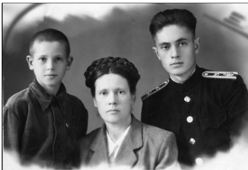
Мама и два сына