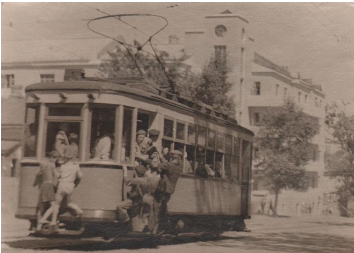
Курские трамваи 40-х годов

скрашивало мое «предкозье» времяпрепровождение. И вот однажды случилось непредвиденное. Все было, как всегда. Я дождался пустого трамвая, он стал набирать ход по кольцу, я прыгнул (наверное, в тысячный раз) на подножку, и ... нога моя с подножки соскользнула, затем обе ноги провалились в пустоту, и я почувствовал, как весь низ тела стремится под колеса трамвая. Руками, правда, я успел схватиться за поручни. И тут мой ангелхранитель, слава Богу, к счастью, дежуривший на моем плече, встрепенулся, вдохнул в меня какую-то сверхсилу. Я подтянулся на руках, вырвал обе ноги из-под колес и тяжело перевалился всем телом на грязную площадку. Я облился потом, дрожали ноги, дрожали руки, я ясно понимал, что несколько секунд назад мог лишиться обеих ног. Тело как будто одеревенело, я не смог сразу выйти из вагона и только когда люди стали садиться в трамвай, я кое-как выполз наружу. С тех пор я перестал прыгать на ходу в трамвай, да и лето близилось к концу.