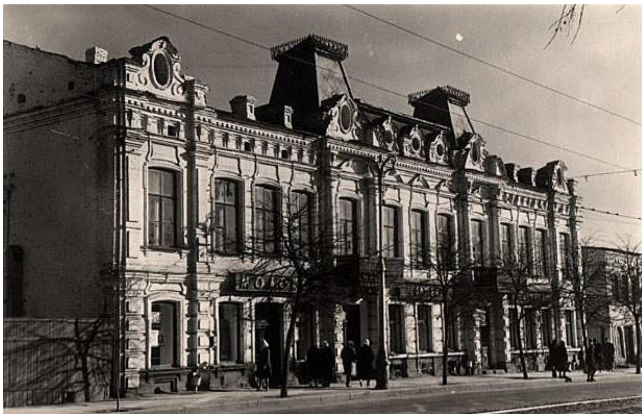
Дом 37 по ул. Ленина