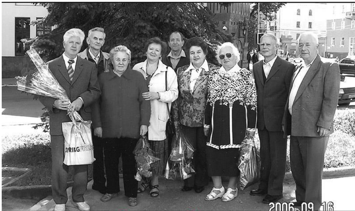
Встреча через 50 лет